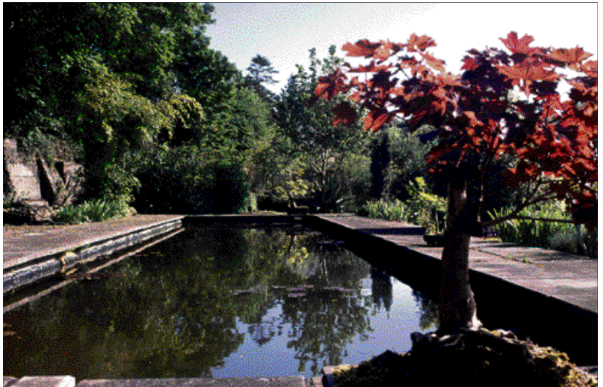
Beelden van Fairbrook.